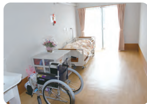
やすらぎの個室は自由に模様替えを楽しめます。共用スペースはモニターを設置。