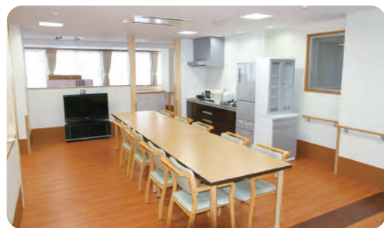
家庭的な雰囲気を大事にしたリビングルーム。