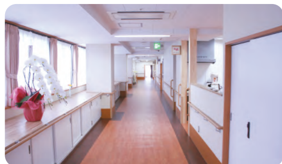
施設内は木のぬくもりを感じられるインテリアで、安心・安全なバリアフリー構造です。