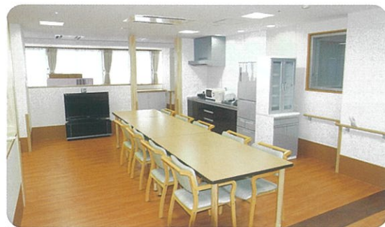
家庭的な雰囲気な大事にしたリビングルーム。