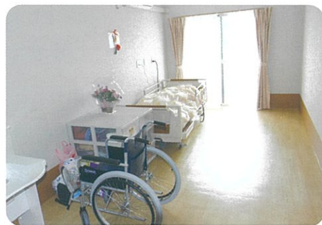
やすらぎの個室は自由に模様替えを楽しめます。共用スペースはモニターを設置。