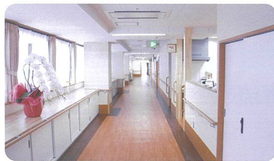
施設内は木のぬくもりを感じられるインテリアで、安心・安全なバリアフリー構造です。